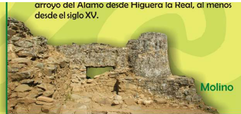
arroyo del Álamo desde Higuera la Real, al menos desde el siglo XV.